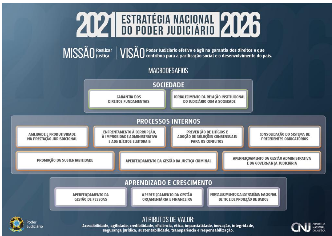
Figura 1 – Mapa da Estratégia Nacional – Anexo da Res. nº 325/2020 - CNJ