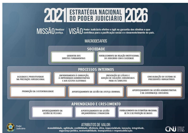
Figura 1 – Mapa da Estratégia Nacional – Anexo da Res. nº 325/2020 - CNJ

O Plano Estratégico do Tribunal de Justiça do Estado do Amapá está alinhado ao Planejamento Estratégico do Poder Judiciário Nacional 2021-2026, instituído pela Resolução nº 325/2020, em cujo Anexo apresenta a Estratégia Nacional com seus Macrodesafios, resumidos no Mapa a seguir: