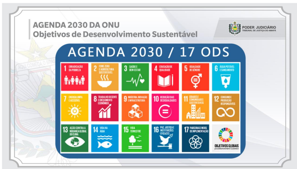
Figura 3- Agenda 2030 da ONU – 17 ODS